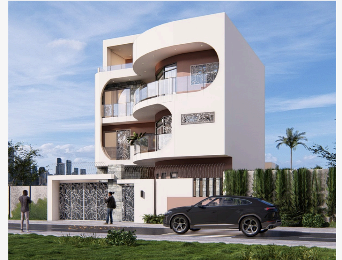
Projet : Villa contemporaine - Projet M. et Mme DIEYE Localisation : Dakar Type : Résidentiel Surface : 180m 2

Composé de cinq (05) chambres, salon, cuisine réparti sur deux (02) étages et terrasse, ce projet de villa contemporaine se distingue par une architecture élégante aux lignes courbes, offrant une façade moderne et dynamique. Les volumes fluides, associés à de larges ouvertures et des garde-corps en verre, favorisent la luminosité et la continuité entre intérieur et extérieur.