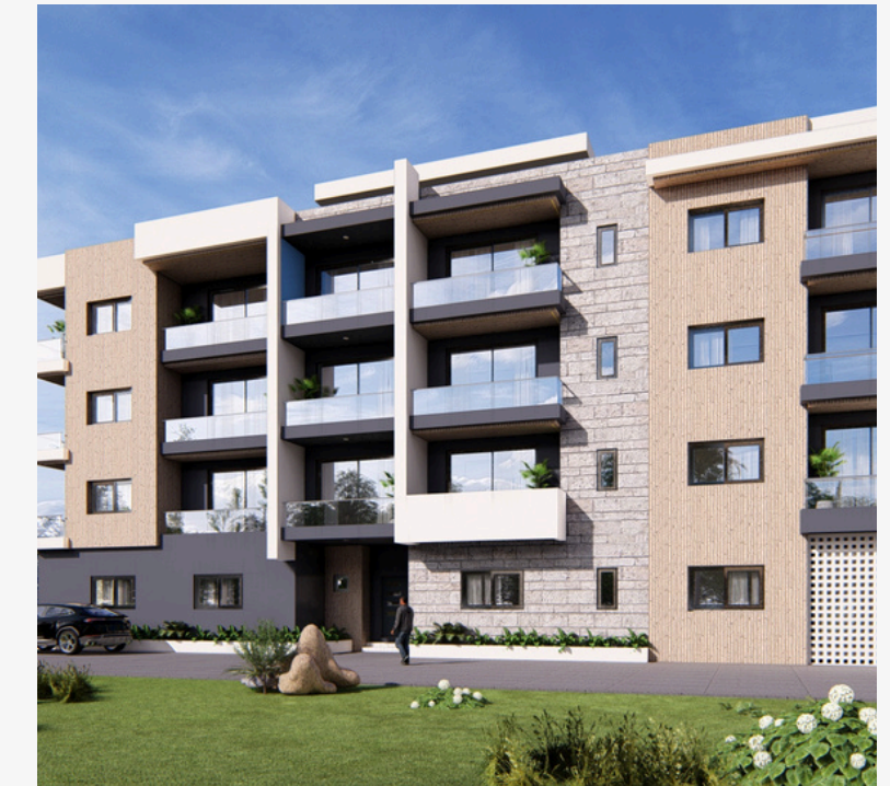
Immeuble résidentiel – Projet M. Dia Localisation : Dakar Type : Résidentiel Surface : 450m 2